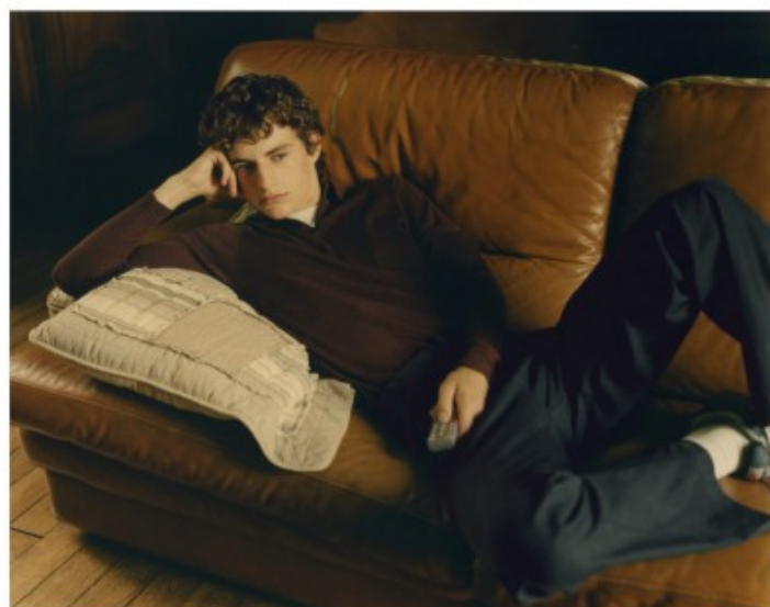
FULL ET PANTALON SAINTE-FERDINAND T-SHIRT VINTAGE CHEZ GAUTHIER BOSSARLLO SHOWROOM CHAUSSETTES PALER BASKETS NIKE CHEZ MAD VINTAGE